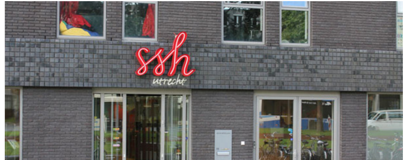
Kantoor van SSH Utrecht op de Uithof

T oen de SSH vorige maand Utrechtse studenten via misleidende informatie verzocht hun huurrechten vrijwillig op te zeggen, kwam “Dakloos Dankzij SSH” in actie en legde het gelijknamige pamflet bij studenten in de bus.