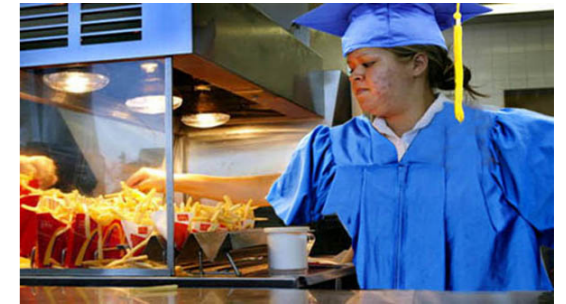
Na je studie aan het werk in McDonald's

O nderzoek toont dat veel banengroei zit in werk waar geen hogere opleiding voor nodig is. Over de professionalisering van werk, polarisatie op de arbeidsmarkt en diplomainflatie in de Westerse kenniseconomieën.