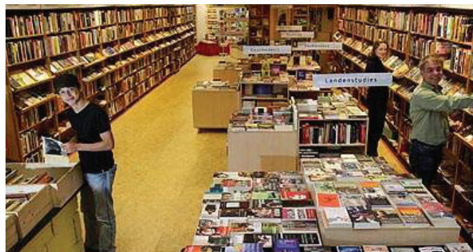
Boekhandel de Rooie Rat aan de Oudegracht

In de lente van 1999 is de Rooie Rat grondig verbouwd en gemoderniseerd. Een aparte afdeling antiquariaat werd aan de boekhandel toegevoegd. Vanaf 2000 tot op heden vinden er bovendien regelmatig lezingen en leesgroepen plaats in de Rooie Rat. Doelstelling van de lezingen is het leveren van een bijdrage aan het links-politieke debat in Utrecht en elders. Zo waren er onder andere lezingen over de boeken 'Empire' van Negri en Hardt en 'De esthetica van het Verzet' van Weiss, Adorno, de wereld na de 11e september, de geschiedenis van 1 mei en de vakbeweging, en de leesgroepen en discussies georganiseerd door Kritische Studenten Utrecht (KSU).