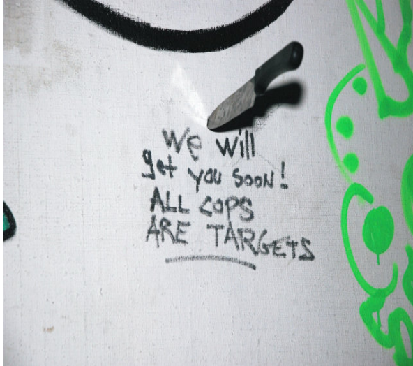
Tekst in kraakpand.

De casussen in dit zwartboek zijn een verzameling van berichten uit de media en verhalen die Amsterdammers aan ons vertelden. Ik hoop dat dit soort verhalen binnenkort niet meer opgetekend kunnen worden.