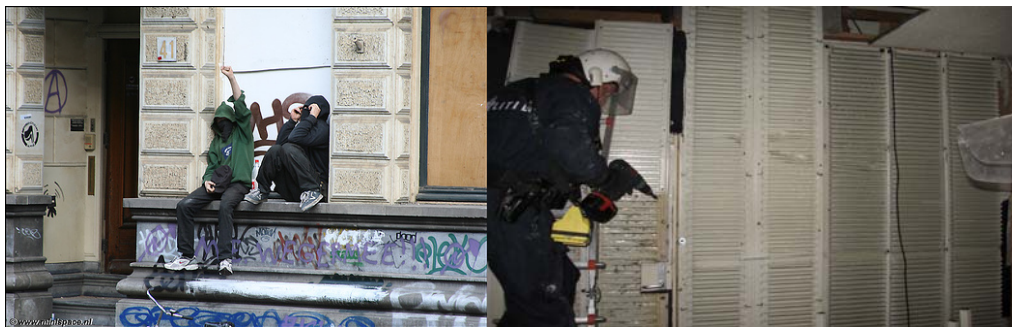
Links: beklad kraakpand met gemaskerde krakers. Rechts: Politievlak na ontruiming.

Vanuit een juridisch gezichtspunt is de twaalf maanden termijn is om alleen al om twee praktische redenen achterhaald. Allereerst is de het voor mensen die hun woning verbouwen vaak niet haalbaar om binnen twaalf maanden een grootscheepse renovatie af te ronden. Voordat alle bouwvergunningen aangevraagd zijn en aan alle eisen is voldaan is iemand al snel anderhalf jaar verder. In Amsterdam zijn veel panden monumentaal. Wanneer iemand een monumentenstatus aanvraagt, vertraagt de beoordelingsprocedure de renovatie nog meer. We hebben verhalen gehoord dat het de krakers zelf waren die een monumentenstatus aanvroegen op een door hen inmiddels uitgewoond pand zodat de eigenaren niet aannemelijk konden maken dat ze snel konden verbouwen.