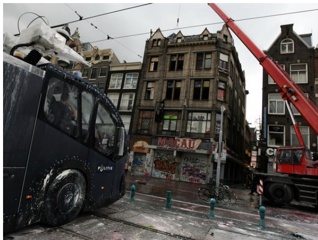
Krakers veroorzaken op het Damrak veel overlast voor omwonenden en winkeliers.

hebben professionele bouwvakkers gewerkt", aldus de politiecommandant over de herkraak van Damrak 16. Burgemeester Cohen sprak hierover op 8 november 2007: "Ondanks werkzaamheden van een aannemer na de ontruiming van het pand (...) moest het pand een dag later weer ontruimd worden. Uiteindelijk zijn drie krakers aangehouden in de kruipruimten van het pand. Dit beeld van ontruiming is niet meer nieuw. (...) Vakkundig worden zware bouwmaterialen geplaatst en extra muurtjes gemetseld."