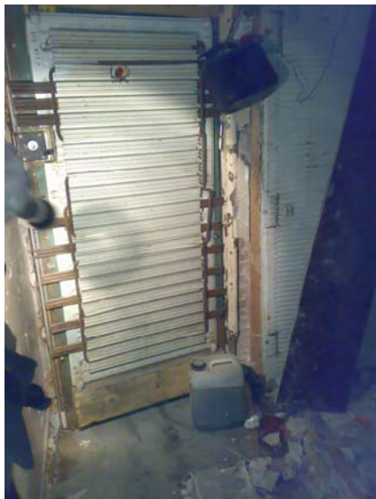
Boobytrap met jerrycans.

commissievergadering Algemene Zaken (AZ) van 8 november 2007: “Het komt helaas voor dat de politie stuit op een levensgevaarlijke situatie zoals bij de Bilderdijkstraat. Het kost veel inzet en capaciteit van de politie en er is ernstig gevaar voor de bewoners, de politie en de krakers zelf.”