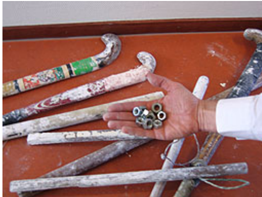
Moeren, hockeysticks en loden pijpen.

Op last van burgemeester Job Cohen werd het pand opnieuw ontruimd. Cohen zei in een reactie zowel de mishandeling als de beschieting van de politie ten sterkste af te keuren. Hij liet weten dat volgens de eigenaar wel degelijk nieuwe bewoners in het pand zullen trekken.