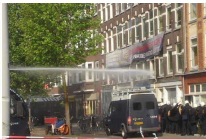
Een spoedontruiming nadat agenten zijn verwond door krakers.

Ontruiming verlopen vaak moeizaam en gaan soms gepaard met excessief geweld. Veelal is er sprake van een geplande tegenactie aan de kant van de krakers op het moment van ontruiming. Zo werden in Amsterdam boobytraps ontdekt. Diverse wapens, scherpe voorwerpen en zware moeren die werden afgeschoten met katapulten zijn gebruikt om de politie op afstand te houden en recentelijk is een agent afgevoerd met een hersenschudding nadat deze bekogeld was met flessen en ander materiaal.