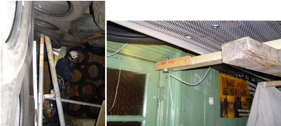
Boobytrap plafondconstructie met daaronder politieman (rechter foto).

De krakers probeerden 'de balkenconstructie' af te doen als een mislukte grap. Wanneer het plafond naar beneden was gekomen, zou die op een brandblusser terecht gekomen zijn waarvan de inhoud eruit zou spuiten. Opmerkelijk was echter dat de brandblusser leeg was volgens de politie en dat de brandblusser er min of meer toevallig leek te staan. Bovendien is het verhaal ongeloofwaardig omdat de constructie die zou neerstorten een groot deel besloeg van het plafond. Het leek eerder een gezochte en ad hoc verzonden verklaring van de krakers die werden geconfronteerd met de foto's. De boobytrap leek erop gericht om doelbewust letsel te willen toebrengen aan agenten. Alle politieke partijen namen met de VVD afstand van de toenemende gevaarlijke kraakacties.