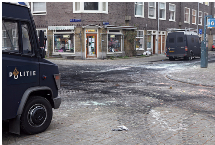
De zwarte aanslag op de weg is het gevolg van brandstichting.

Het slachtoffer: "Niet alleen de bedreigingen zijn erg onprettig, ook werden enthousiaste mensen lastig gevallen tijdens de bezichtigingen. Je wilt je eerste huis na lange voorbereiding kopen. Eindelijk is het zover en dan heb je van dat agressieve publiek voor je. De krakers brachten ook nog allerlei onjuiste berichten over me in de wereld. Dat met die bedreigingen en vernieling van mijn kantoor is niet fijn, stel je voor dat je kleine kinderen hebt."