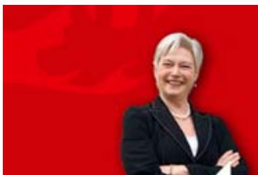
Minister van der Hoeven CDA

Inmiddels staan de wetsvoorstellen op 24 maart 2009 geagendeerd op de agenda van de Eerste Kamer. Als men daar de plannen niet rigoureuus afwijst zou men instemmen met het goedkeuren van de wetsvoorstellen 31320 en 313742 die tegen alle fundamentele burgerrechten van onze grondwet en van het internationale verdrag van de rechten van de mens indruisen.