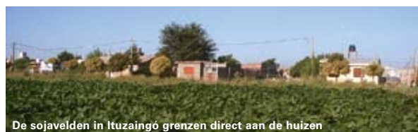
De sojavelen in Ituzaingó grenzen direct aan de huizen

een rechter in Santa Fe, Argentinië, middenin een enorm sojagebied. De gezondheid is belangrijker dan de soja, zo luidde de conclusie. De gentech-soja waar het hier om gaat groeit op grond die niet recent is ontbost en voldoet wat dat betreft aan de criteria voor 'verantwoorde' soja. Met de huidige beperkte criteria is de kans groot dat deze soja straks het label 'verantwoord' krijgt.