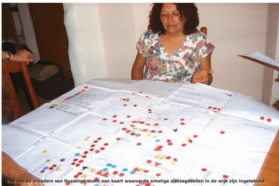
Een van de moeders van Itzaingó toont een kaart waarop de ernstige ziektegevallen in de wijk zijn ingetekend.

Seeds of Deception , goed boek over genetische manipulatie: www.seedsofdeception.com