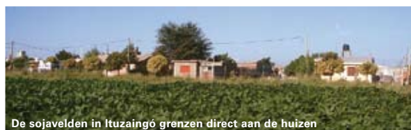
De sojavelden in Ituzaingó grenzen direct aan de huizen

een rechter in Santa Fe, Argentinië, middenin een enorm sojagebied. De gezondheid is belangrijker dan de soja, zo luidde de conclusie. De gentech-soja waar het hier om gaat groeit op grond die niet recent is ontbost en voldoet wat dat betreft aan de criteria voor 'verantwoorde' soja. Met de huidige beperkte criteria is de kans groot dat deze soja straks het label 'verantwoord' krijgt.